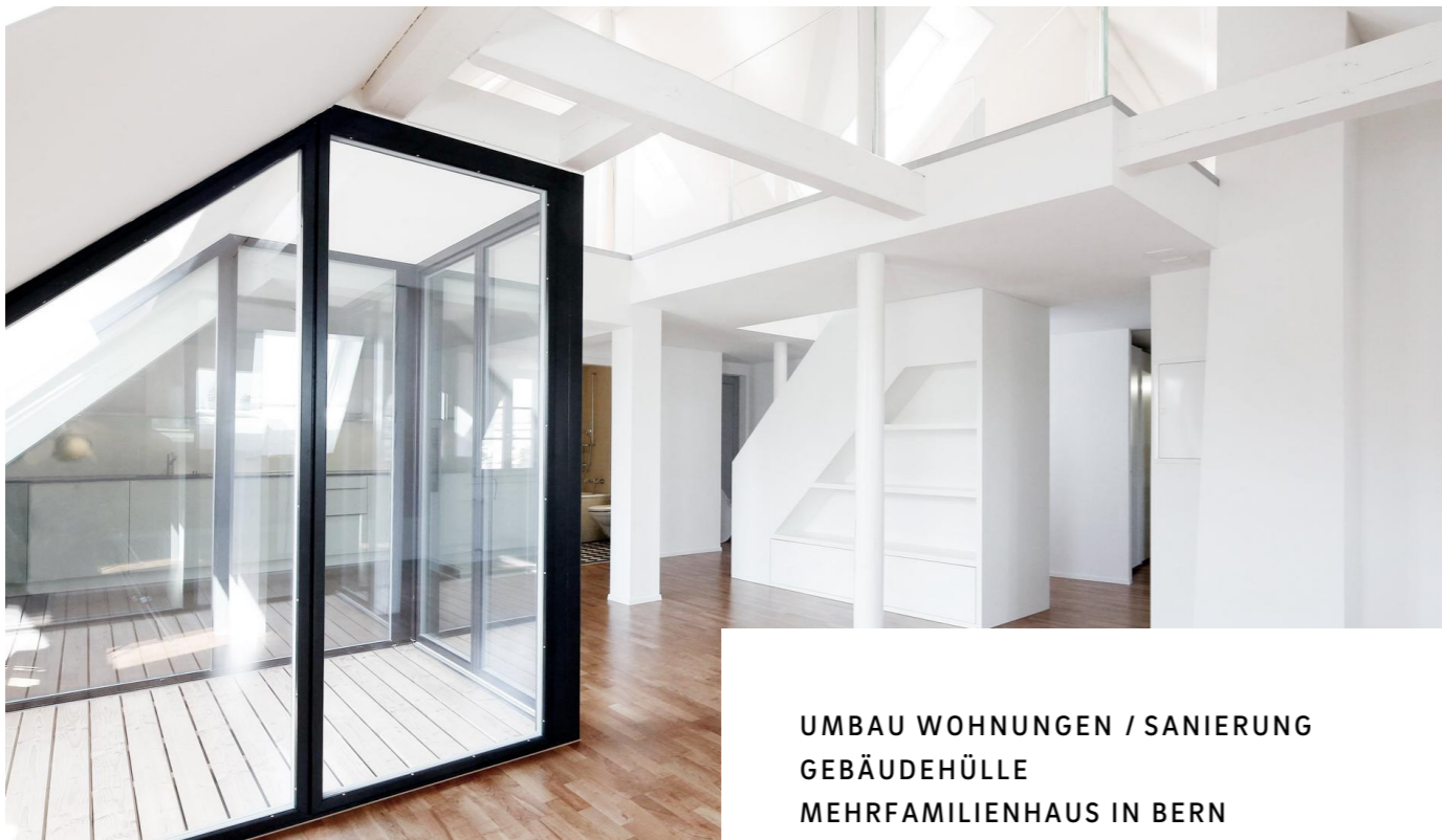
UMBAU WOHNUNGEN / SANIERUNG GEBÄUDEHÜLLE MEHRFAMILIENHAUS IN BERN